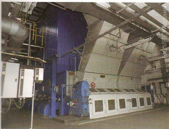
Zmodernizowany kocioł WR 25 - 014 SN nr 4

Osiągnięte sprawności kotła charakteryzują się bardzo dobrym poziomem. Mogą one ulec dalszemu wzrostowi przy stosowaniu węgla o mniejszej zawartości podziarna.